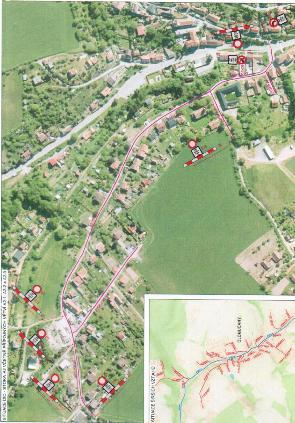
SITUACE DIO - STOKA A2 VČETNĚ PŘÍPOJNÝCH VĚTVÍ A2-1, A2-2 a A2-3